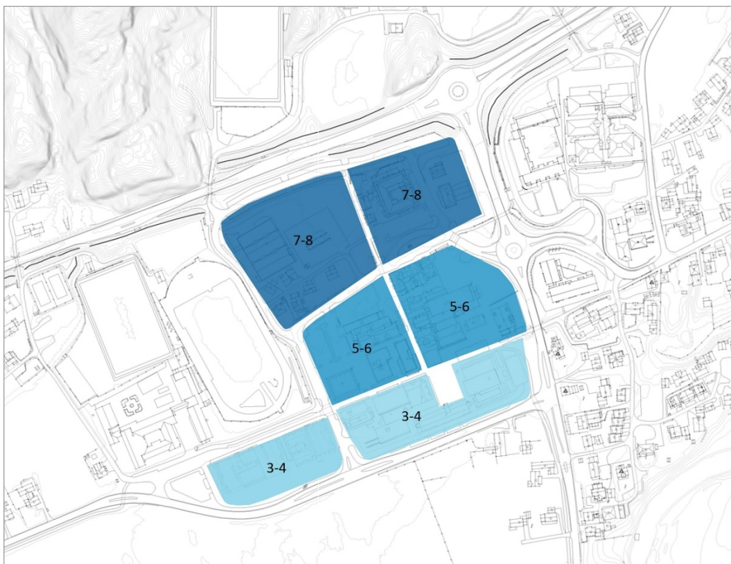
Forenklet skisse som viser forslag til maksimalt antall etasjer i soner på Tangvall