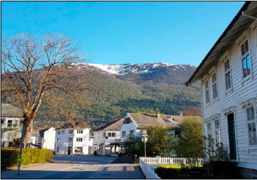
2. plass i Årets lokale klimatilaktak 2015: Eid kommune for grønn finansforvaltning