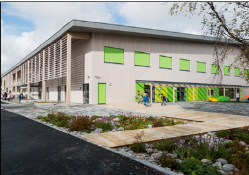
3. plass i Årets lokale klimatilaktak 2015: Fredrikstad kommune for Lislebyhallen

Velkommen til å delta i Årets lokale klimatilaktak – KS' og miljøstiftelsen ZEROs årlige klimakonkurranse for kommunesektoren.