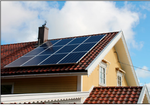
Vinner av Årets lokale klimatilaktak 2015: Hvaler kommune for Hvaler solpark