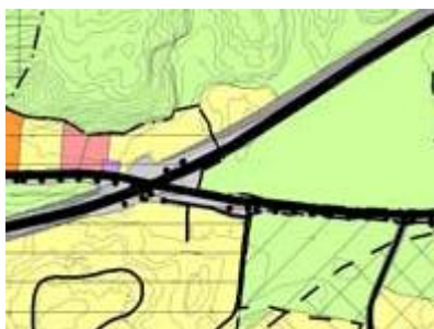
Utsnitt kommuneplan Meieribakken

Administrasjonen vil foreslå at punktet om gjenoppbygging i områder for spredt boligbebyggelse og fritidsbebyggelse tas inn i bestemmelsene som vedtatt av kommunestyret. Punktet om gjenoppføring i områder for bebyggelse og anlegg foreslås tatt ut av bestemmelsene og tatt med som retningslinje. I de vedtatte retningslinjene står det at i LNF-områder kan bygninger og anlegg bygges opp igjen etter brann eller naturskade.